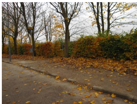
Affald og andet der er til ulempe for færdslen skal fjernes